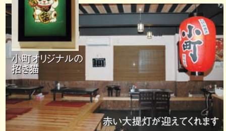
赤い大提灯が迎えてくれます