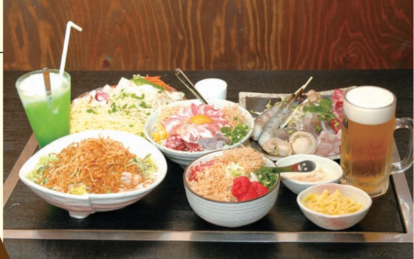
豊富なメニューに満足!