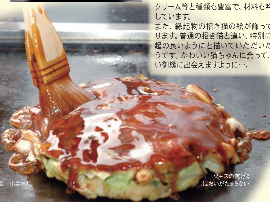
ソースの焦げる においがたまらない!