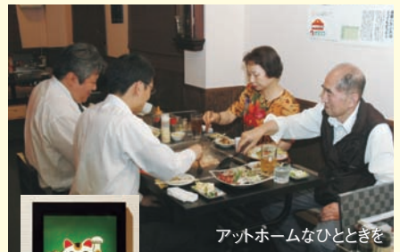
アットホームなひとときを

赤 い大きな提灯が目印の、お好み焼き「小町」さんは、地下鉄南北線王子神谷駅より徒歩5分、庚申通りを少し入った閑静な住宅街にあります。木の香りのする新しい広々とした店内は、掘りコタツ席、イス席、カウンター席、とバリアフリーになっていて、家族連れから車椅子の方まで、幅広く楽しめます。お好み焼きが大好きで、昨年10月に開店しました。店の名は、秋田生まれなので「小町」とつけました。おすすめの小町ミックス天は、具材が色々入って栄養バランスもよく、山芋の入った生地は味もふんわりとしていて、たまらない歯ごたえです。鉄板焼きの小町盛は、海鮮と焼き肉カルビを合せた贅沢盛…。元祖もんじゃ焼、元祖お好み焼き、デザートにアイスクリーム等と種類も豊富で、材料も吟味しています。また、縁起物の招き猫の絵が飾ってあります。普通の招き猫と違い、特別に縁起の良いようにと描いていただいたそうです。かわいい猫ちゃんに会って、良い御縁に出会えますように…。