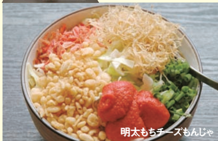
明太もちチーズもんじゃ